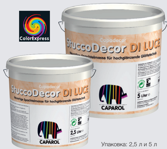
Упаковка: 2,5 л и 5 л

прибл. 160-180 мл/м 2 при двуслойном нанесении. Точный расход следует определять с помощью пробного нанесения.